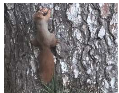
Photo d'un écureuil