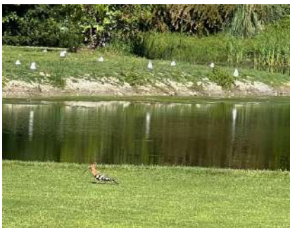
Photo d'une huppe fasciée