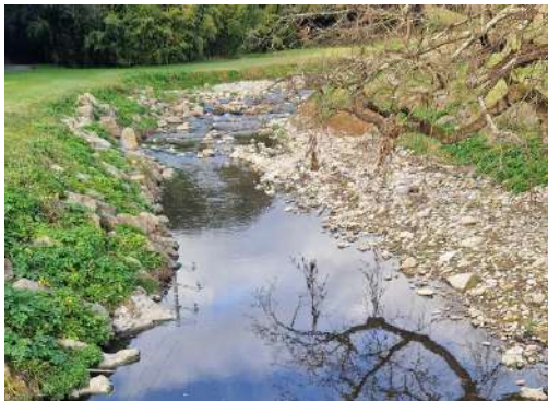
La Mourachonne après l'arrachage de la jussie rampante