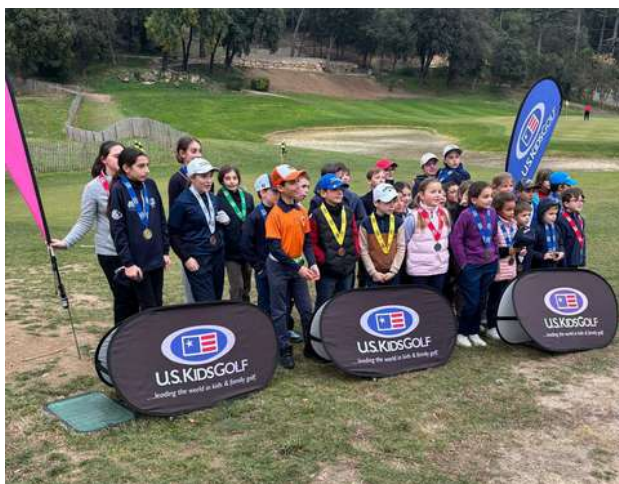
Article rédigé par Daniel ORTELLI

Après une étape à Marseille La Salette (19 janvier), les deux derniers grands rendez-vous de ce Winter Paca Tour auront lieu à Opio-Valbonne (1er février) et surtout le lendemain à la Grande Bastide (2 février) pour la finale (points doublés).