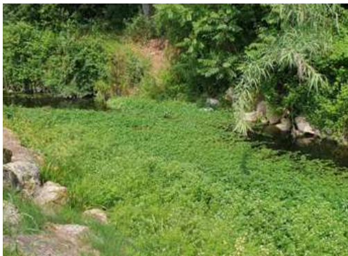
Exemple de jussie rampante dans l'eau

L'équipe de jardinier a réalisé un gros travail d'arrachage mécanique et manuel de la jussie rampante sur toute la rivière, soit plus d'un kilomètre !