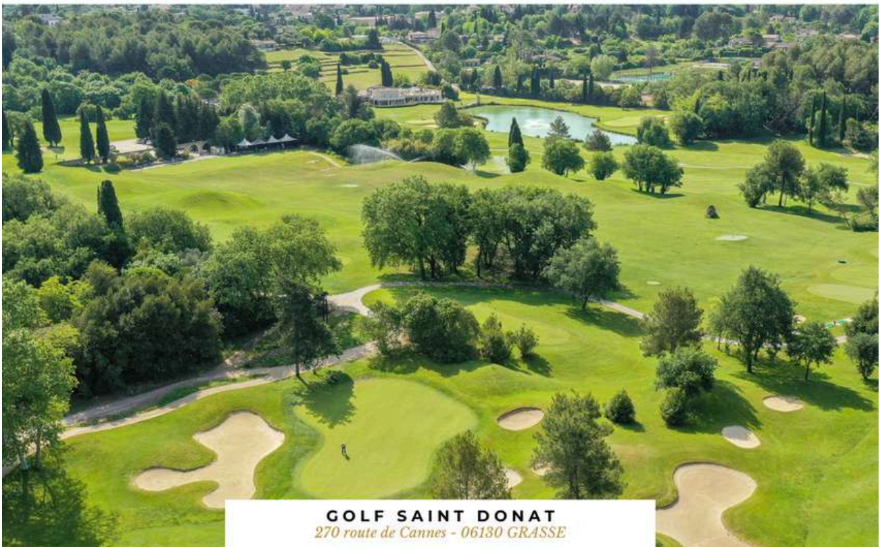
GOLF SAINT DONAT 270 route de Cannes - 06130 GRASSE

*Compétition réservée aux abonnés de Saint Donat et à leurs amis licenciés ffgolf.